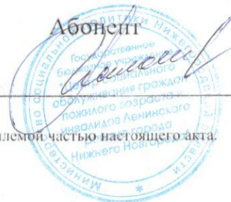
Схема разграничения эксплуатационной ответственности является неотъемлемой частью настоящего акта.